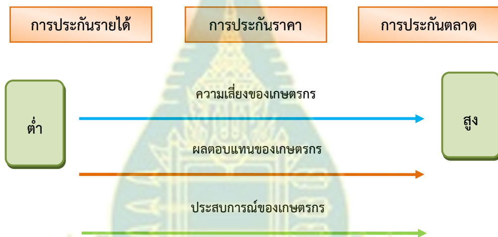
ภาพที่ 2.1 รูปแบบเกษตรพันธะสัญญา

ดังกล่าวไว้ล่วงหน้าแล้ว เกษตรกรมีบทบาทเป็นผู้ร่วมทุนเพราะต้นทุนปัจจัยการผลิตที่ได้รับมาจะถูกหักเป็นค่าใช้จ่ายเมื่อมีการส่งมอบผลผลิต บริษัทจะชำระส่วนต่างของรายได้และค่าใช้จ่ายที่เกิดขึ้นในแต่ละรอบของการเลี้ยง และความผิดพลาดจากการเลี้ยงเกษตรกรต้องรับความเสี่ยงเอง สำหรับการประกันตลาดนั้น เกษตรกรเป็นผู้ลงทุนเองทั้งหมดโดยผลผลิตที่ได้มีตลาดรองรับที่แน่นอน อย่างไรก็ตามในกรณีนี้เกษตรกรต้องเสี่ยงกับราคาที่ผันผวนแต่ไม่ต้องทำตลาดเอง รวมทั้งรับความเสี่ยงต่างๆ ที่อาจเกิดขึ้นในกระบวนการผลิตทั้งหมด ดังนั้นการประกันตลาดจึงเหมาะกับเกษตรกรที่มีความชำนาญและประสบการณ์สูงจึงจะประสบความสำเร็จ อย่างไรก็ตามรูปแบบการประกันตลาดนี้ก็ให้ผลตอบแทนสูงกว่าแบบอื่น อันเป็นไปตามหลักการลงทุนที่ว่า ความเสี่ยงสูง ผลตอบแทนก็ย่อมสูง หรือ high risk, high return นั่นเอง